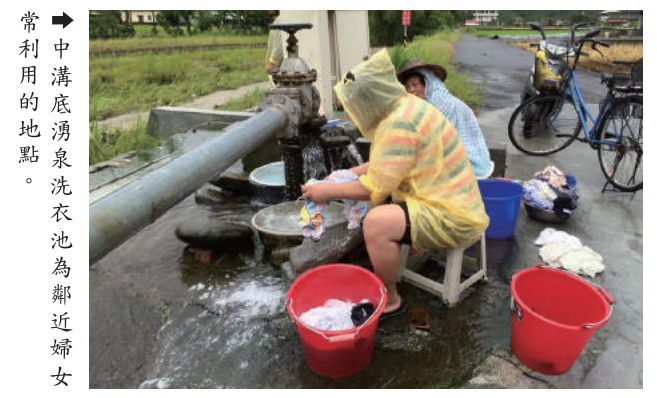
中溝底湧泉洗衣池為鄰近婦女常利用的地點。