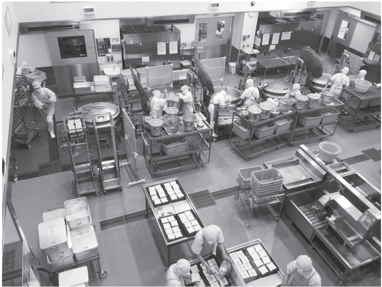
右圖：參觀成田市本田小學校營養教師食育課程，日本教師所使用的教具，製作精美且生動有趣。 左圖：伙食中心不僅有嚴格的衛生管制，且整體的作業流程井然有序。

回應食安層出不窮、學童過胖、外食比例過高、蔬果攝取不足、國人慢性病有升高趨勢等社會議題，高雄市政府教育局自2013年開始，推動為期3年的「飲食教育中程計畫」，立志要與世界飲食運動接軌，以「安全、健康、食在高雄」為目標，訂立了設立食農教育推動組織、結合環境教育及強化在地食材等五大執行方針，並成立食農教育資訊網，建立資訊共享的平台。