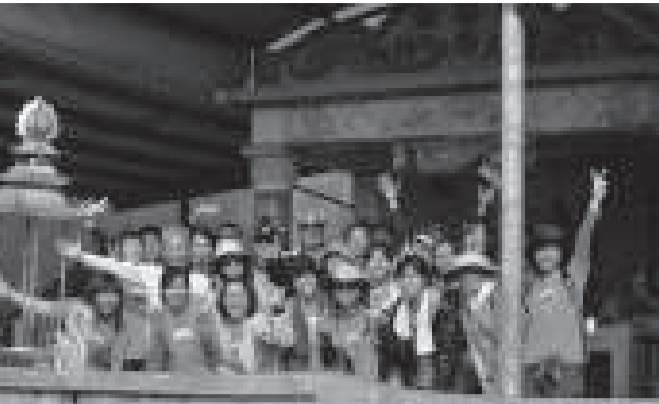
在入口的田尾坑伯公祠進行開工儀式後大合照。

去年(2016)九月從《聯合報》讀到一則地方新聞，標題是「被遺忘的日本老校長紀念碑找到了」，大意是：美濃公學校(美濃國小)第三任校長黑川龜吉大正6年(1917年)上任，大正9年(1920年)11月去世。臨終前寫一封信給學校，希望葬在月光山，在一個能看見學校的高處繼續守護美濃學子。新聞照片裡，一座保存完好的日式石碑，上面寫著「故黑川先生之碑」。