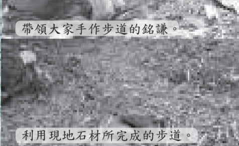
利用現地石材所完成的步道。