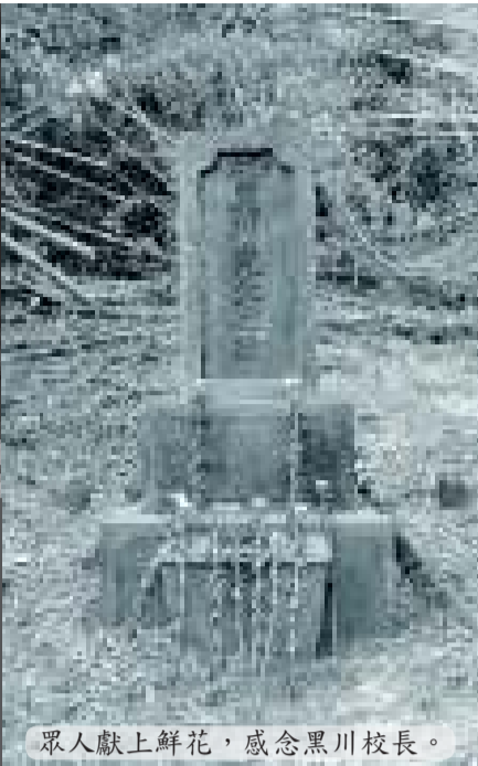
眾人獻上鮮花，感念黑川校長。