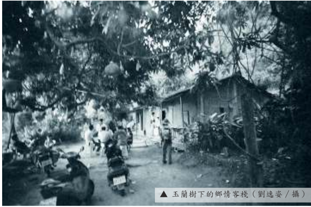
▲ 玉蘭樹下的鄉情客棧

【鍾理和基金會訊】美濃東北角廣興地區有一大埤頭聚落，由於位處於主要道路之外，一般除了在地居民進出則外人罕知，因此也保留下純樸的田園景觀與濃厚的在地人情味。 大埤頭取名來自早年早季時居民築埤引水灌溉，聚落以大埤頭開基伯公為中心開散聚落發展，居民多依姓氏聚居，如黃家、楊家、傅家、李家等姓氏夥房。開基伯公背靠化胎有一大叢老芒果樹，樹倚一座小山呈現出客家傳統的天人觀。