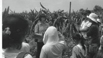
► 同心園農場一片佔地七分面積的紅龍果園，都是用無毒農法耕作，友善環境的同時，除了收成健康的農產品，也維繫了生態平衡。