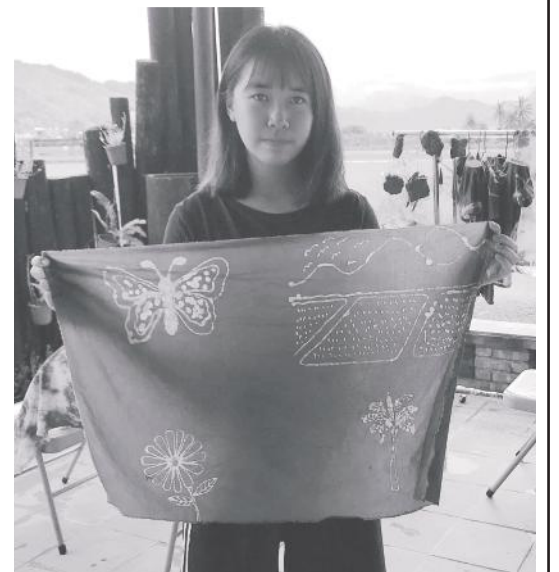
▲ 蠟染與藍染的結合 。