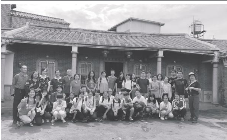
▲ 美濃國中新任校長與師生參觀里港下武洛鍾屋夥房，比較閩南匠師與客家匠師建造夥房的差異。