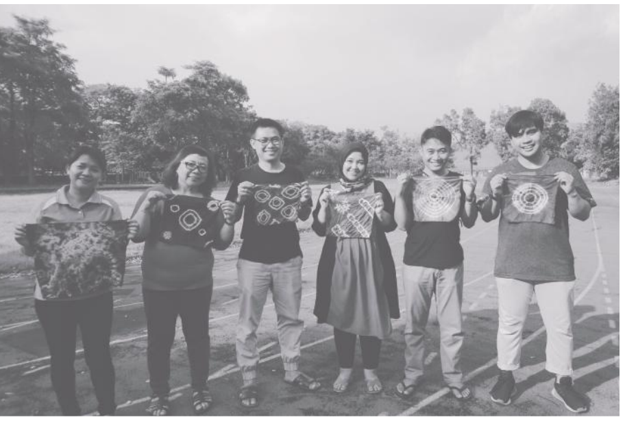
▲印尼夥伴首次體驗客家藍染。