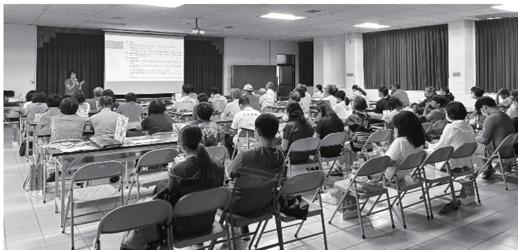
講座現場有來自美濃及杉林的農會成員、青農、社區工作者

糧食安全與糧食主權：同一件事嗎？ 講座一開始，王乃震博士就拋出一個問題：「糧食安全與糧食主權，真的是同一